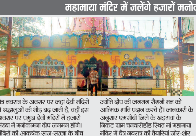
चैत्र नवरात्र के अवसर पर जहां देवी मंदिरों में श्रद्धालुओं की भीड़ बढ़ जाती है, वहीं इस अवसर पर प्रमुख देवी मंदिरों में हजारों संख्या में मनोकामना दीप जलाने होंगे। मंदिरों की आकर्षक साज-सज्जा के बीच ज्योति दीप की जगमग रोशनी मन को आत्मिक शांति प्रदान करते हैं। जानकारी के अनुसार एमसीबी जिले के खडगवां के निकट ग्राम चनवारोड स्थित मां महामया मंदिर में चैत्र नवरात्र की तैयारियां जोर-शोर से की जा रही हैं। यहां बड़ी संख्या में मनोकामना दीप प्रज्वलित की जाती है। साथ ही यहां कोरिया-एमसीबी के अलावा, कोरिया पेड़ा मरवाही तथा कोरिया जिले से भी काफी संख्या में श्रद्धालु मत्था टेकने पहुंचते हैं। आगामी 19 मार्च से शुरू होने वाले चैत्र नवरात्र पर कोरिया-एमसीबी जिले के प्रमुख देवी मंदिरों में आस्था का सैलाब पूरे नौ दिनों तक उमड़ेगा। प्रमुख देवी मंदिरों में श्रद्धालुओं की भीड़ इतनी जटिल है कि मंदिर परिसर व क्षेत्र में मेलें जैसा नजारा बना रहता है। बुझ होने के साथ ही श्रद्धालु माता के दर्शन एवं मत्था टेकने के लिए पहुंचते लगते हैं और यह क्रम शाम ढलने के बाद तक बनी रहती है।

19 मार्च को प्रतिप्रद तिथि पर घट स्थाना के साथ मां दुर्गा का आगमन डोली पर होगा। घट स्थापना के दौरान ग्रहो का दुर्लभ संयोग अत्यंत शुभ फलदायक साबित होगा। वहीं 19 मार्च को जहां चैत्र नवरात्र की शुरुआत हो रही है, इसी दिन विक्रम नववर्ष भी शुरू हो रहा है, इससे खुशियां दुगुनी हो जाएंगी, इसके साथ ही पूरे नौ दिनों तक शक्ति के देवी की आराधना विधि-विधान के साथ की जाएगी। देवी मंदिरों में माता के जयकारे के साथ जसगीत गुंजने शुरू हो जाएंगे। तेज धूप के बीच भी भक्ति कम नहीं होगी। विभिन्न क्षेत्रों के श्रद्धालु दूर-दूर तक देवी मंदिरों एवं आस्था केन्द्र पहुंच कर विधि-विधान के साथ पूजा-अर्चना एवं व्रत करते हैं।