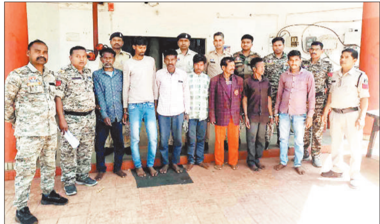
पुलिस गिरफ्त में अफीम खेती व तस्करों के आरोपी।

बता दें कि बलरामपुर जिले के कुसमी विकासखंड अंतर्गत ग्राम त्रिपुरी के चोसराडांड